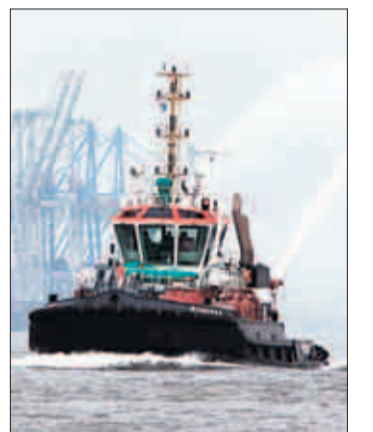
Seit wenigen Tagen im Einsatz: „Bugsier 5“.

Mit der „Bugsier 5“ ist jetzt der stärkste Schlepper im Hafen in Dienst gestellt worden. Die Daten: 82,6 Tonnen Zugkraft, 6800 PS und drei drehbare Propeller. Insgesamt eine Kombination, mit der sich auch die großen Containerschiffe auf engem Raum gut bewegen lassen, wie es bei der Bugsier-Reederei heißt. Bisher haben die kräftigsten Schlepper im Hafen rund 70 Tonnen Zugkraft. Zudem kann „Bugsier 5“ Feuer bekämpfen: 2400 Tonnen Wasser pro Stunde pumpt die Anlage, Sprühnebel sorgt zugleich für den Eigenschutz.